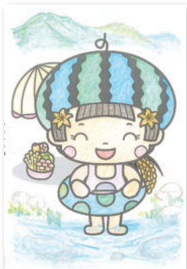
塩沢の風景さん(55歳)