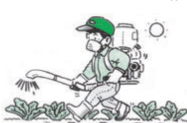
エ 農薬の散布 作業