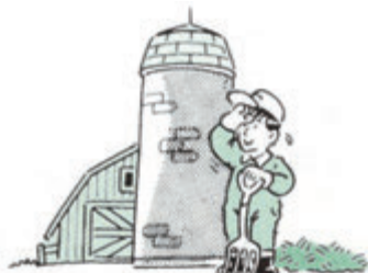
ウ サイロ、むろなどの酸素 欠乏危険場所での作業