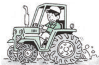
ア 動力により駆動する 機械を使用する作業