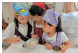
マヨネーズ作りに挑戦!