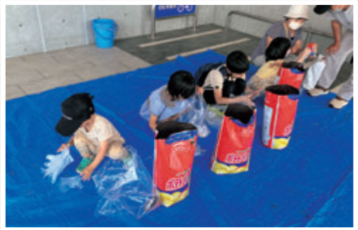
じゃがいもが無事に育つかな？