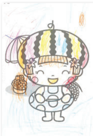
プリキュアさん(4歳)