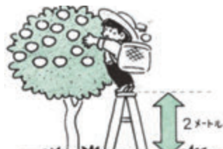
イ 高さが2メートル以上の箇所 での作業