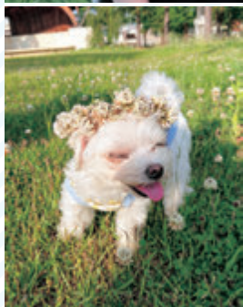
さくらに癒されています