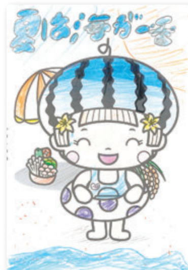
そらりあすさん(8歳)