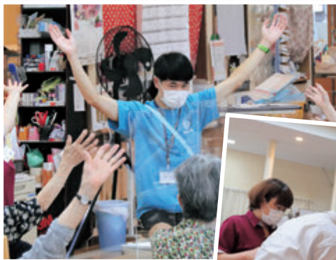
新潟医療福祉大学

JAでは、各学校からの依頼により出前授業や職場体験の受け入れを行っています。6月下旬のおおまき小での出前授業と、新潟医療福祉大学からの介護実習受け入れの様子を紹介します。