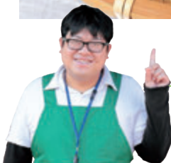
阿部店長より お客様へ一言

見た目はきゅうりのようなズッキーニですが、実はカボチャの仲間です。イタリア料理やフランス料理などによく使われ、日本で広まり始めたのは1980年代からと言われています。