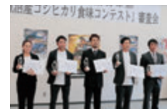
令和4年度受賞者の皆様