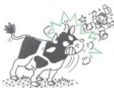
オ 牛、馬、豚に接触し、または 接触するおそれのある作業