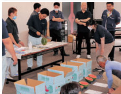
小玉西瓜「八色っ娘」