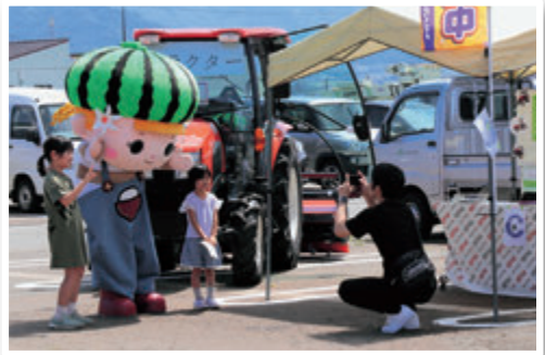
ほなみちゃんも登場しました

イベントでは、JAのキャラクター「ほなみちゃん」のスタンプを各事業所に設置し、スタンプラリーを開催しました。そのほか、園芸講習会や資産形成相談会、梅加工教室の開催やドライビングシミュレーター「きずな号」の体験など行い、スタンプを揃えた参加者にはくじ引きで粗品をプレゼントしました。