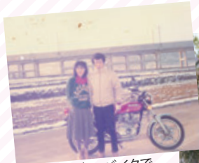
愛車のバイクで 出掛けたことも