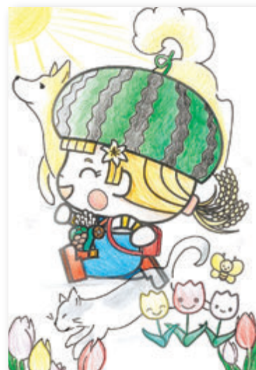
まろの飼い主さん(21歳)