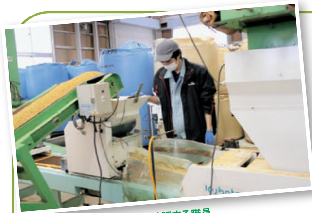
播種を確認する職員