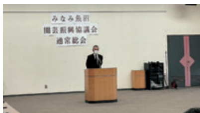
みなみ魚沼園芸振興協議会

JAでは、農業者の所得増大と南魚沼ブランドの品質向上に向けた取り組みを支援しています。