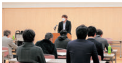
しおざわ稲作部会