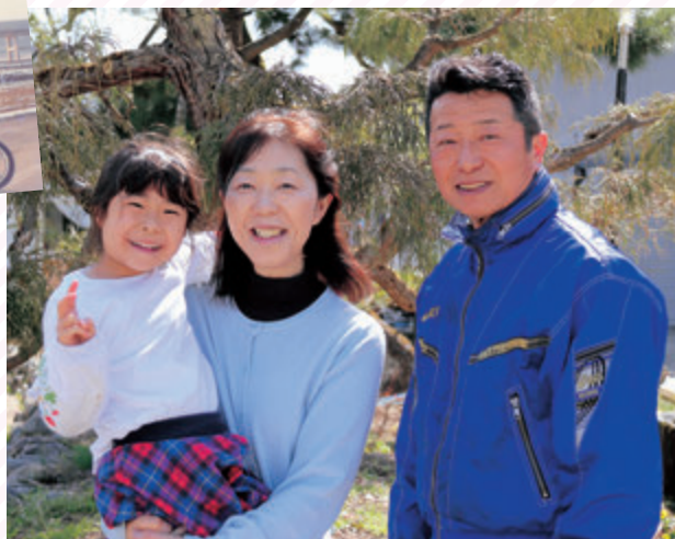
かわいい孫も一緒に