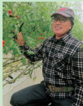
農事組合法人アグリコム雷土