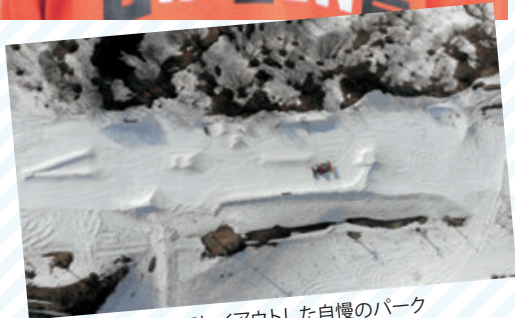
イベントでレイアウトした自慢のパーク