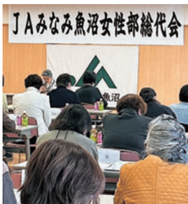
JAみなみ魚沼女性部