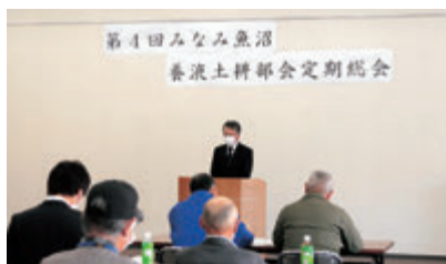
みなみ魚沼養液土耕部会