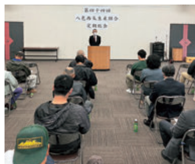
八色西瓜生産組合