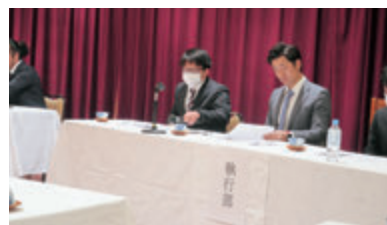
JAみなみ魚沼青年部