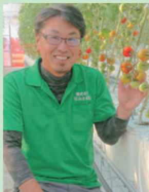
株式会社りふるむ