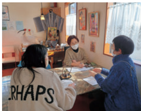
意見交換をする部員