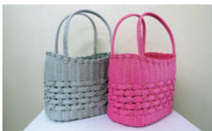
毎週集まって制作しているので、腕前がぐんぐん上達! プロ級です☆