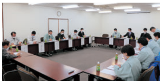
農家組合の位置付けや今後の在り方について協議しました

JAでは農家組合は地域に必要な組織と考えております。農家組合活動を支援するため、今後、各答申にもとづき、具体的な内容や取り組みについて広報誌等でご案内していく予定です。