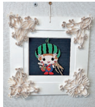
フレームの飾りはトイレットペーパーの芯を使用。まつ毛や髪の毛の稲穂など細部まで丁寧に仕上がっています!