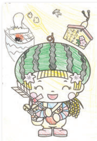
ひなっぴーさん(7歳)