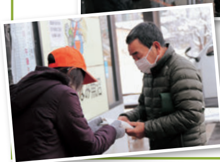
寒さも 吹き飛びそうな 笑顔