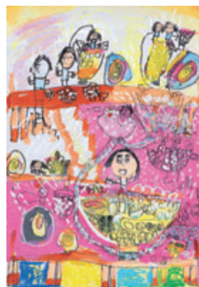
「おこめがいっぱいある しあわせのおこめランド」