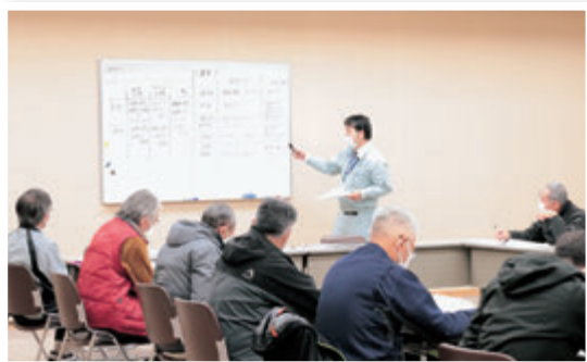
会場では前向きな質問が多くあがりました