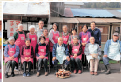
仲間の支えがあってこそこの15年でした