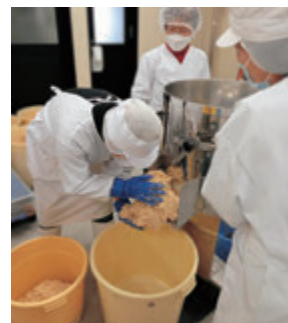
加工1日目は、11名分95kgの味噌を仕込みました