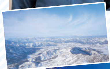
雪山からの絶景を 味わえます

高3からバックカントリースキーを始めました。バイトをしてカメラを買い、いろんな景色を撮影したいと思っていたところ、元ススキーも好き、車の免許を取った…ということで、バックカントリースキーを始める条件が揃ったんですね(笑) 手つかずの雪上を滑る爽快感、特に天気の良い日は最高です! 昨年のゴールデンウィークに立山に行ったときは天気もよく、雪山からの壮大な景色は日常を忘れさせてくれるくらい、とても気持ちが良かったです。仕事が大変でも、この景色を見るためと思えば頑張れますね。