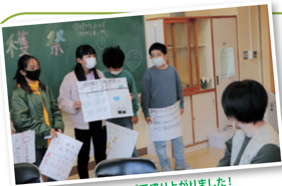
自作のクイズで盛り上がりました！