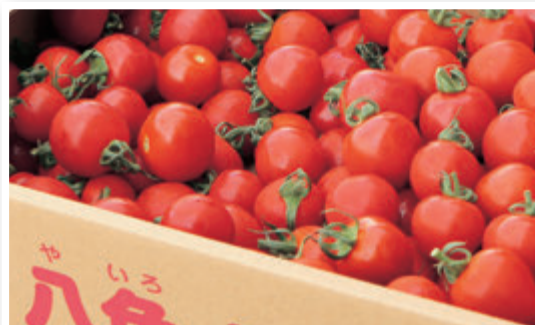
来年度もおいしいミニトマトを

今年度は、部会員数の減少に伴い栽培面積や生産量が減少しましたが、販売単価が好調だったため、売上高はほぼ昨年並みとなりました。来年度は販売数量の確保や品質の向上に取り組み、更なるブランド力強化を目指していきます。