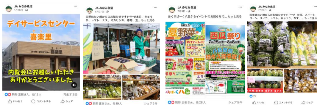
J Aみなみ魚沼 facebook