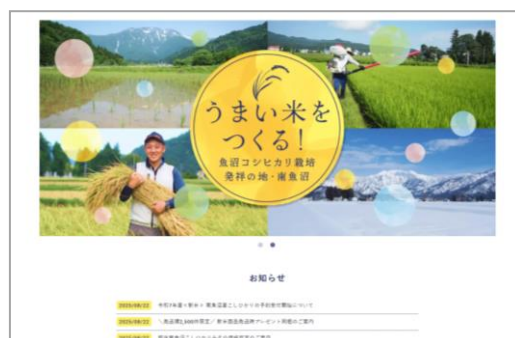
オンラインショップ